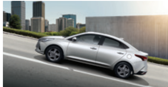
Асистент допомоги при старті в гору (Hillstart Assist Control), HАС Зупинка і старт на дуже крутій дорозі можуть бути стресом і потенційно небезпечними. HАС запобігає скочуванню автомобіля назад, коли гальмівна педаль відпускається на пагорбі.