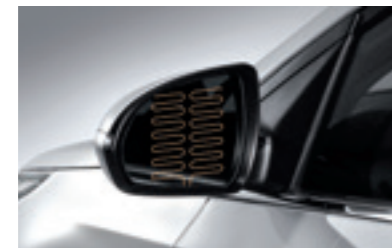
Обігрів дзеркал заднього виду