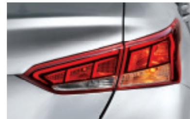
Задні комбіновані вогні