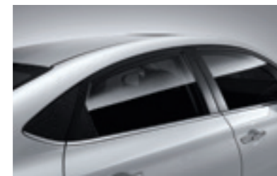
Металізоване оздоблення лінії скла