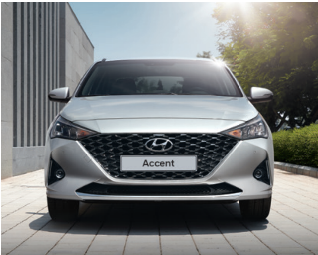
Аеродинамічно спроектована передня частина з параметричним дизайном решітки радіатору