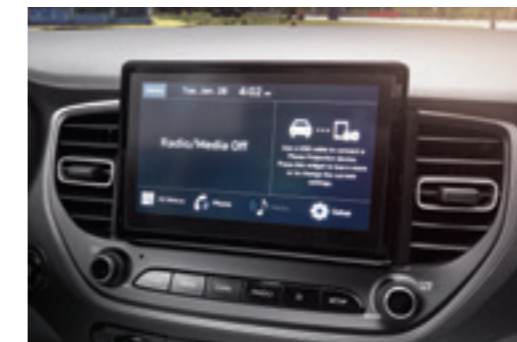
Мультимедійна система з 8-дюймовим кольоровим дисплеєм Підтримуючи Bluetooth 4.0, який взаємодіє з вашим смартфоном, цей багатофункціональний кольоровий сенсорний ЖК-дисплей відображає зображення з камери заднього виду, час/дату, статус MP3-програвача, а також налаштування AM/FM радіо з RDS.