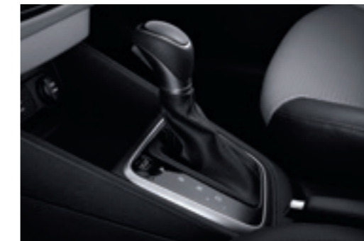
6-ступенева автоматична коробка передач

Навряд чи ви помітите, як ця 6-ступенева коробка передач робить свою справу. Автоматичне перемикання швидке, плавне, тихе і дуже зручне. А енергоефективна конструкція допомагає знизити витрати палива.