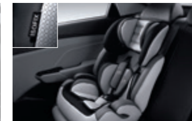
Кріплення для встановлення дитячих крісел