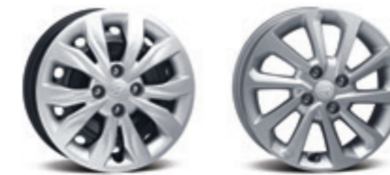
Сталеві диски R15 з ковпаками