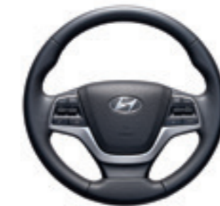
Кермо з функціями дистанційного керування аудіо-системою, круїз-контролем та Bluetooth.

Стильно та зручно обладнаний інтер'єр автомобіля забезпечує ідеальний простір для відпочинку та продуктивності. Щойно опинившись у салоні, вас здивують спокій і тиша, адже новий Accent ще краще захищений від шуму дороги та вітру. 8-дюймова діагональ екрана мультимедійної системи полегшує доступ до інформації, що неймовірно зручно при управлінні контентом синхронізованого із мультимедіа смартфона. Новий Accent підтримує Apple CarPlay™ і Android Auto™, що дозволяє підключати смартфон до мультимедійної системи автомобіля і дзеркально відображати програми на великому сенсорному дисплеї.