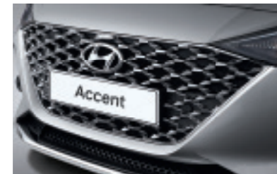
Параметрична хромована решітка