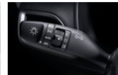
Потрійний сигнал повороту в один дотик