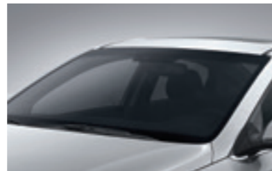
Базове тонування скла