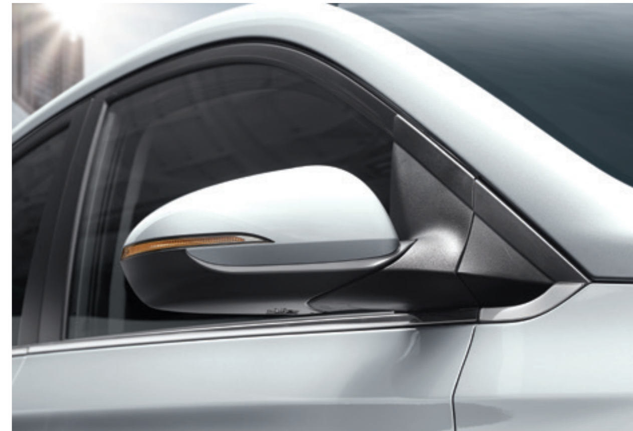
Повторювач сигналу повороту на дзеркалах заднього виду