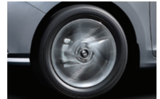
Задні та передні дискові гальма (14")

Для водіїв, які понад усе дбають про економічність витрат пального понад усе, 6-ступенева механічна КПП — ідеальний вибір. Робота зчеплення легка і передбачувана, і коли ви переходите з однієї передачі до іншої, то відчуваєте характерну чіткість.