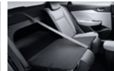
Складання задніх сидінь (60:40)