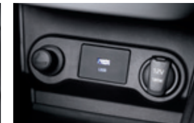
Порт USB та порт живлення 12V