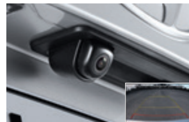
Камера заднього виду