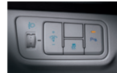
Регулювання підсвічування панелі приладів та можливість відключення ESC