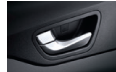
Металізоване оздоблення внутрішніх ручок дверей