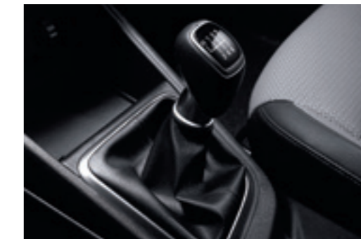
6-ступенева механічна коробка передач

Навряд чи ви помітите, як ця 6-ступенева коробка передач робить свою справу. Автоматичне перемикання швидке, плавне, тихе і дуже зручне. А енергоефективна конструкція допомагає знизити витрати палива.