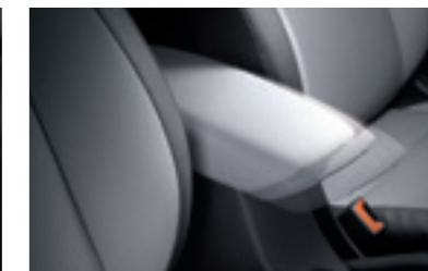
Підлокітник для передніх сидінь