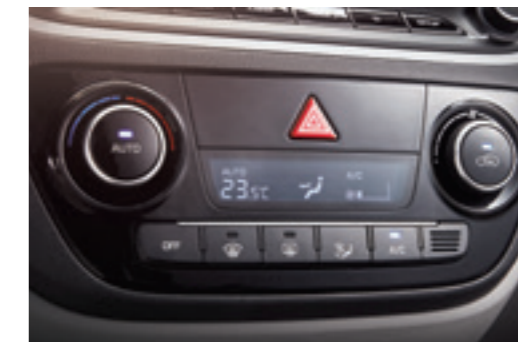
Клімат-контроль Просто встановіть цифровий датчик на бажану температуру, а потужний кондиціонер забезпечить охолодження, обігрів та вентиляцію. Всередині нового Accent вам буде вам буде абсолютно комфортно, незалежно від зовнішніх погодних умов.