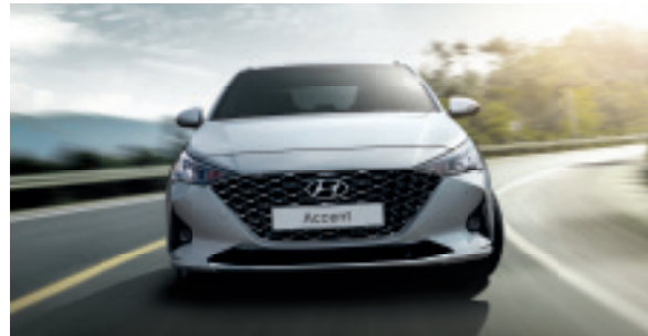
Система електронної стабілізації (Electronic Stability Control), ESC ESC може виявити занос і автоматично підгальмовувати окремі колеса для протидії втраті керування, сприяючи підтримці стійкості автомобіля та зменшенню ризику зіткнення.

З того самого моменту, як уперше сідаєш у новий Accent, тебе охоплює відчуття цілковитої безпеки. І це більше, ніж просто відчуття. Це — беззаперечний факт. Новий Accent захищає тебе і твоїх близьких за допомогою найсучасніших технологій безпеки. Новий Accent також має посилений кузов, чого вдалося досягти за допомогою використання більшого вмісту надміцної сталі.