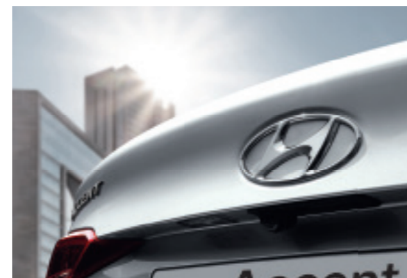
Інтегрований у багажник спойлер