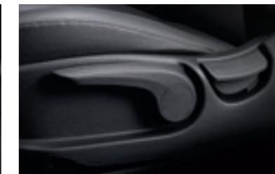
Регулювання сидіння водія по висоті