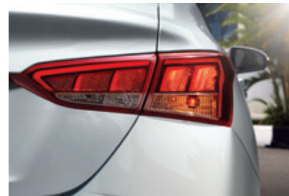
Задні комбіновані ліхтарі

Футуристичний дизайн нового Accent підкреслює його сучасність і технологічність. Неодмінно увагу приверне решітка радіатора, яка вирізняється новим сміливим параметричним дизайном. Зовнішній вигляд нового Accent беззаперечно привертає до себе погляди: виразний та елегантний автомобіль доповнено стильними деталями екстер'єру, що вигідно виділяють модель з-поміж інших седанів класу.