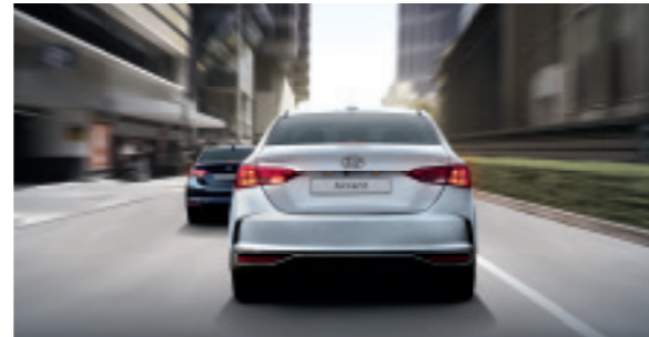
Сигнал аварійної зупинки Розуміючи різницю між звичайним та аварійним гальмуванням, ця функція автоматично почне блимати аварійними вогнями при виявленні раптового сильного натискання на гальмівну педаль, таким чином попереджаючи водіїв позаду.