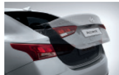
Дистанційне відкриття багажнику